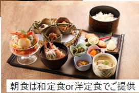
朝食は和定食or洋定食でご提供