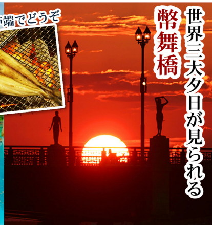
世界三大夕日が見られる 幣舞橋