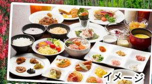
イメージ 2日目朝食は、全70種類以上のブッフェを絶景とともに