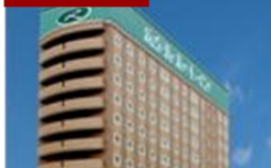
ルートイン釧路駅前 又は 釧路ロイヤルイン