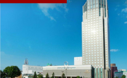
ホテルエミシア札幌