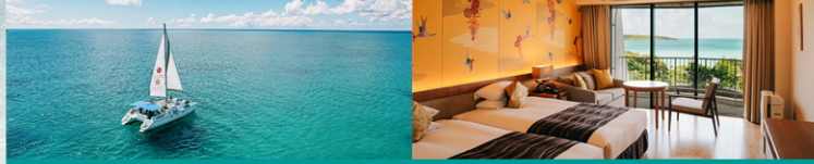
宮古島東急ホテル&リゾート (洋室1-4名1室)

自然を満喫できるアクティビティも充実。 目の前に広がる紺碧の海と白い砂浜を眺めながら、 心やすらぐひとときをお過ごしください。