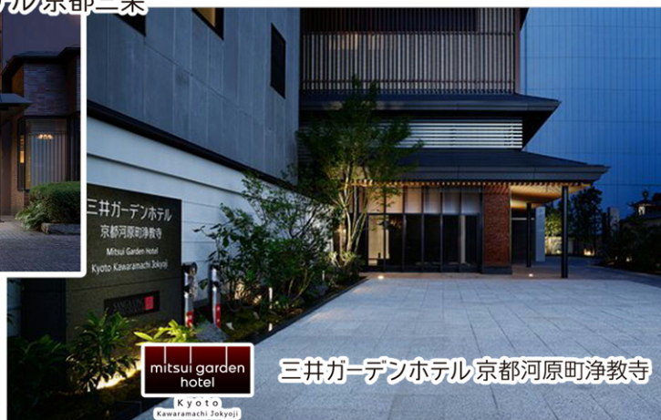
mitsui garden hotel 三井ガーデンホテル京都河原町浄教寺 Kyoto Kawaramachi Zokyo