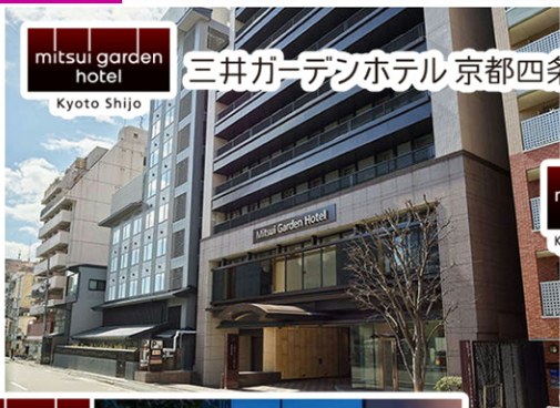
mitsui garden hotel 三井ガーデンホテル京都四条 Kyoto Shijo