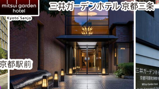
mitsui garden hotel 三井ガーデンホテル京都三条 Kyoto Sanjo