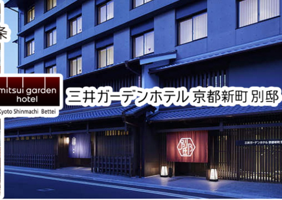
mitsui garden hotel 三井ガーデンホテル京都新町別邸 Kyoto Shinmachi Bettei