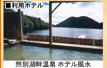
然別湖畔温泉 ホテル風水